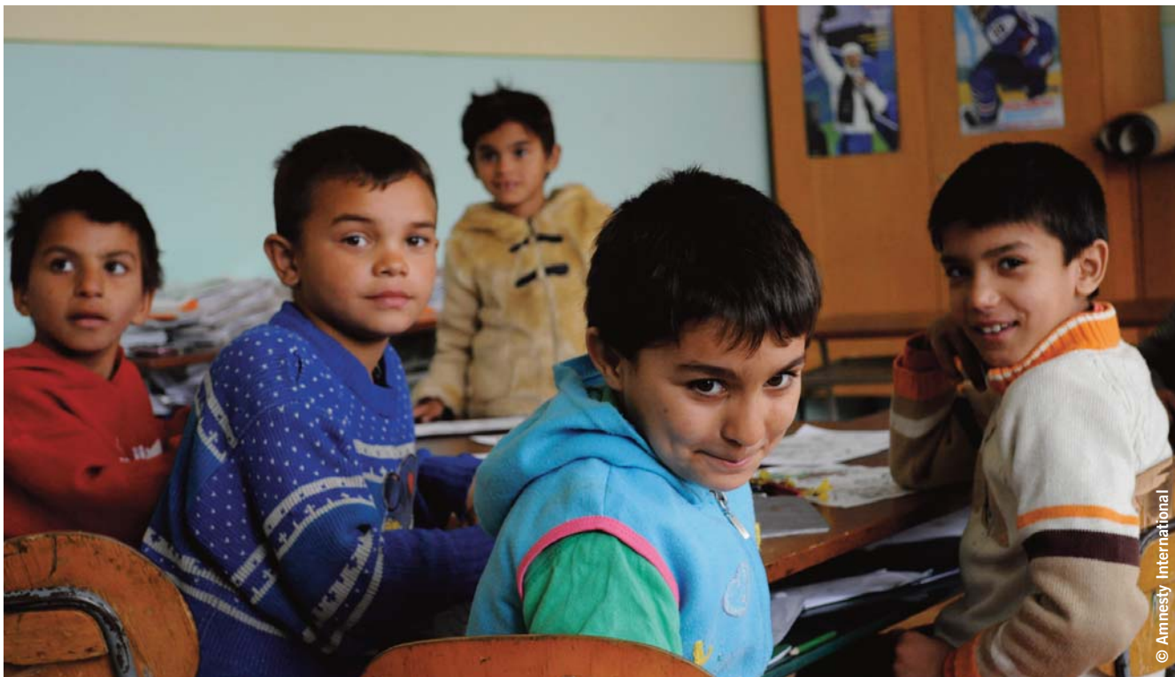
Sopra: Bambini rom in una classe speciale della scuola elementare di Krivany, aprile 2010.