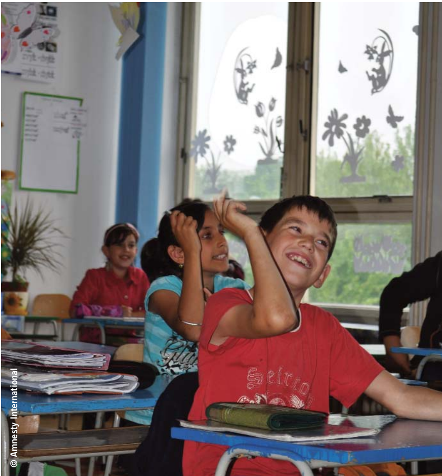
Alunni rom e non rom durante una lezione in una classe mista alla scuola elementare tradizionale di Pavlovce nad Uhom, Slovacchia, maggio 2010.

costantemente visti come socialmente svantaggiati, questo sistema fornisce i presupposti concreti per classificare i bambini rom come alunni con difficoltà di apprendimento. Di fatto, questo sistema non solo non riesce a soddisfare le esigenze educative di questi bambini, ma li incatena a vita alla condizione di svantaggiati, mettendo in relazione la loro condizione sociale di indigenza con la loro capacità mentale. L'assenza di misure efficaci per ridurre l'impatto dello svantaggio sociale e il fatto che il termine "svantaggiato" sia usato spesso come sinonimo di rom, porta all'ingiusta introduzione dei bambini rom nel sistema educativo speciale. Una volta che gli alunni sono stati riconosciuti come aventi "difficoltà d'apprendimento" e introdotti nel sistema scolastico parallelo, il loro programma di studi viene sostanzialmente ridotto.